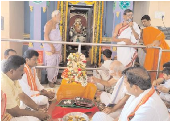
ఘనంగా వసంత పంచమి