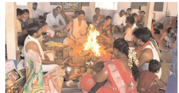
శ్రీ సరస్వతి శిశు మందిర్ లో