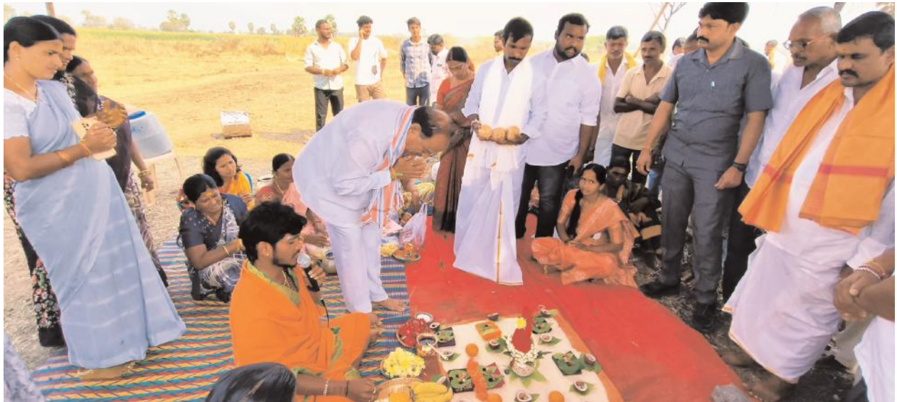
లక్కమారి కాపు పెడరేషన్ ఏర్పాటుకు సహకరిస్తూ కులాలకతీతంగా సమాజంలో ఒకరికొకరు గౌరవించుకోవాలి