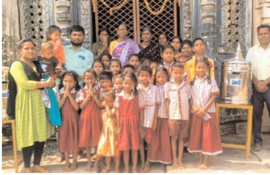
కోట గుళ్ళ లో నందిగామ విద్యార్థుల విజ్ఞాన విహారయాత్ర