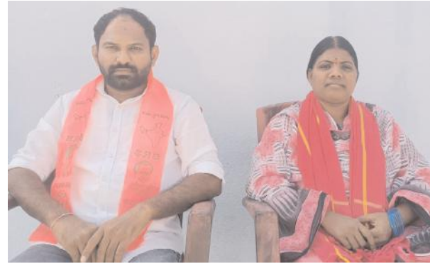
ప్రజల సౌకర్యార్థం జిల్లా కేంద్రానికి రోడ్డు నిర్మాణం గురించి అడిగితే