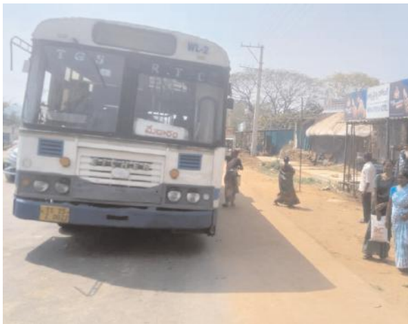
అయినా ఆర్టీసీ బస్సులో ఉచితంగా సుఖంగా ప్రయాణించి దేవతలను దర్శనం చేసుకోవచ్చు. తల్లులకు నిలువెత్తు బంగారాన్ని మొక్కుబడులు

ములుగు/ తాడ్యాయి సూర్యప్రతినిధి ఫిబ్రవరి 8 (మేజర్ న్యూస్): మినిమేడారం జాతరకు తరలివచ్చే మహిళలకు ఉచిత బస్సుప్రయాణంను ప్రభుత్వం కల్పించింది. ఏడాది కింద జరిగిన మహాజాతరకు మహిళలకు ఉచితబస్సు ప్రయాణం కల్పించింది. అదే తరహాలో అనంతరం ఫిబ్రవరి 12 నుండి 14 వరకు జరిగే మినిజాతరకు కూడ మంత్రి సీతక్క సిఎం దృష్టికి తీసుకెళ్లి మహిళలు దూరప్రాంతాల నుంచి మేడారాకి రావాలంటే ఇబ్బందితో కూడుకుని ఉంటుంది. మేడారం తరలివచ్చే మహిళ భక్తులు మూటమట్టే, పిల్లాపాపలతో ఉంటారని ఉచిత ప్రయాణాన్ని సమకూర్చినారు. ఈ విషయం ఉమ్మడివరంగల్ జిల్లాలోనే కాకుండా తెలంగాణ రాష్ట్రంలో ఎక్కడినుంచి