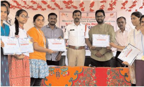
క్రీడాకారులు భవిష్యత్తు లో గొప్ప స్థాయికి చేరాలి