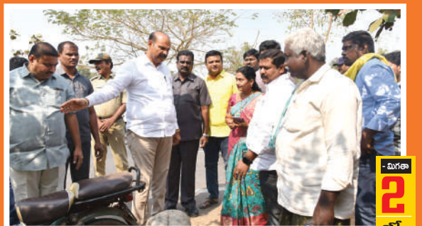
- మిగతా 2లో..