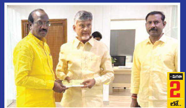
- మిగతా 2లో..

సీఎం సహాయనిధికి రూ.2 లక్షల చెక్కు అందించిన ఎమ్మెల్యే బడేటి