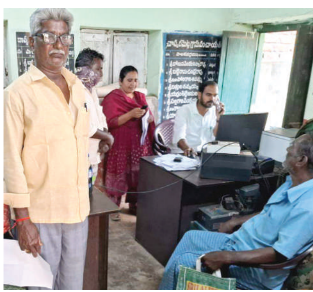
గుర్తింపు సంఖ్య కేటాయిస్తారని తెలిపారు. ఈ కార్యక్రమంలో రైతు సేవా కేంద్రం సిబ్బంది తదితరులు పాల్గొన్నారు.