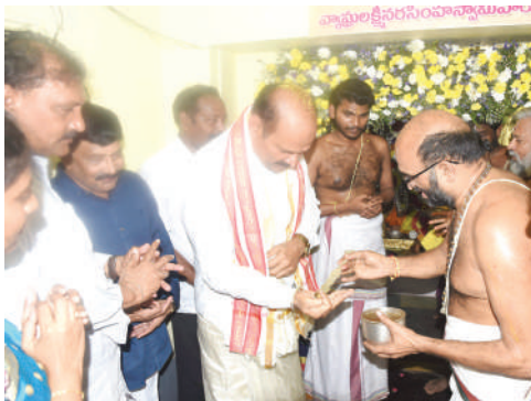
- తరువాయి 2లో..