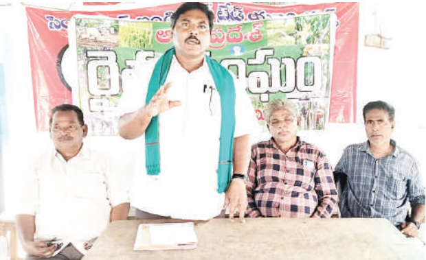
- సిసిబి పత్తి కొనుగోలు కేంద్రాలు ఏర్పాటు చేయాలి