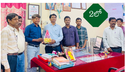
నిర్మల్ ప్రతినిధి, సూర్య మేజర్ స్కూల్ జిల్లా కేంద్రంలోని రవి హైస్కూల్, సోన్ ప్రభుత్వ ఉన్నత పాఠశాలలోని పదవ తరగది పరీక్ష కేంద్రాలను శుక్రవారం జిల్లా కలెక్టర్