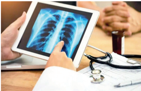
ఉన్నట్లు వైద్య ఆరోగ్యశాఖ నిర్ధారించింది.