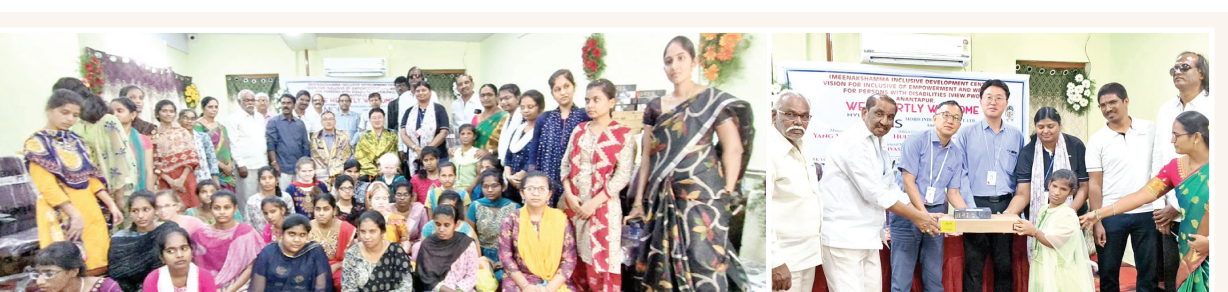
అంధ విద్యార్థినులకు సాంకేతిక చేయూత..