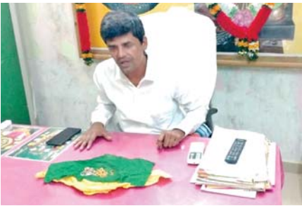
దొంగలించేందుకు యత్నించిన బంగారు సొత్తులు