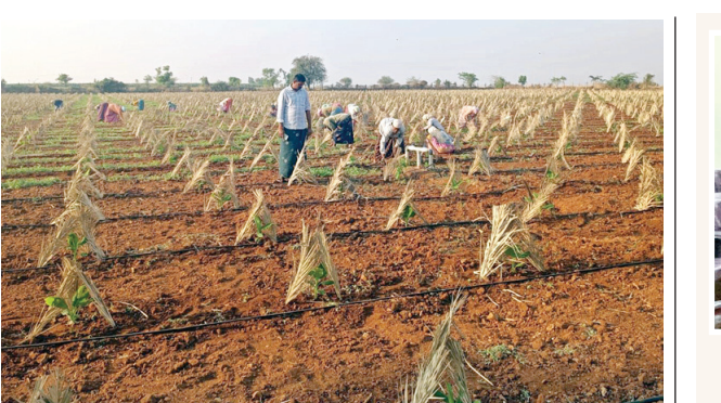
అరటి మొక్కలకు నీడ కోసం రైతు అగచాట్లు

అనంతపురం నగరపాలక సంస్థలో పాలకవర్గం పగ్గాలు చేపట్టి నేటికీ నాలుగేళ్లు పూర్తి అవుతోంది. ఇక మిగిలింది ఒక యేడాదే. అక్కడే అసలు కథ మొదలైంది. ఆర్థికంగా బలంగా ఉన్న ఓ రెడ్డి. ఆర్థికంగా, రాజకీయంగా బలంగా ఉన్న మరో రెడ్డి. ఈ ఇద్దరే కాకుండా మాజీ ముఖ్య ప్రజా ప్రతినిధి ఇంటి చుట్టూ నిత్య ప్రదర్శనలు చేసే మరో రెడ్డి. ఇలా వేరసి మొత్తం ముగ్గురు రెడ్లు అనంతపురం నగరపాలక మేయర్ పీఠంపై కన్నేసినట్లు వినికొడి. ఇప్పటికీ ఈ ముగ్గురు రెడ్లలో ఓ రెడ్డి తెదేపా ముఖ్య ప్రజా ప్రతినిధి ఆశీస్సులతో ఐదు మంది కార్పొరేటర్లను కూడా తన వశం చేసుకున్నట్లు సమాచారం. వీరే కాక అతని అభిమానులు, అన్నబీయలైన మరో 25 మంది వరకు మద్దతు కూడబెట్టిన ఆలోచనలో ఉన్నట్లు తెలిసింది. అయితే ఈ విషయాలన్నీ ఏ రోజుకు ఆ రోజు వైకాపా జిల్లా ముఖ్య నేత, మాజీ ప్రజా ప్రతినిధి వేగులాల ద్వారా సమాచారం తెలుసుకుంటున్నాడనీ తెలిసింది. తనకు మేయర్ సీటుకు మద్దతు తెలుపుతున్నట్లుగా ఆ సభ్యుల సంతకాలతో విజయవాడ పెద్దలను ఒప్పించుకునేందుకు ఆ దిశగా ప్రయాణం ఆ రెడ్డి చేస్తున్నట్లు సమాచారం