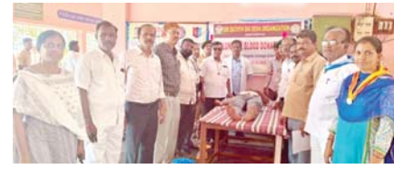
విద్యార్థి దశ నుంచే తనలో సేవా దృక్పథాన్ని అలవరుచుకోవాలి, అప్పుడే సమాజంలో ఉన్నత స్థాయికి

సామాన్యులను బురిడీ కొట్టించడానికి వీరు ఖరీదైన రిసార్టుల్లో సమావేశాలు పెడతారు. సూటు, బాటు వేసుకుని మహా గురూజీ అంటూ కనికట్టు మాటలతో మభ్యపెడుతుంటారు. అరచేతిలో స్వర్ణం చూపిస్తుంటారు. అంతేకాక కొంత మందిని తీసుకొచ్చి ఇప్పటికే రూ. లక్షలు తమ బ్యాంక్ ఆకౌంట్లో పడుతున్నట్లు, కార్లు ఇల్లు కొన్నట్లు, విదేశాల టూరి తిరిగినట్లు చెప్పిస్తుంటారు. దీంతో పలువురు యువకులు తమ తల్లిదండ్రులు వద్దంటున్నా వీరికి సొమ్ముచెల్లించి దబ్బులు నష్టపోయి, జరిగిన మోసాన్ని చెప్పకోలేక ఇబ్బంది పడుతున్నారు. ఈ విషయంలో ఇప్పటికైనా పోలీసులు దృష్టి సారించాలని పలువురు కోరుతున్నారు.