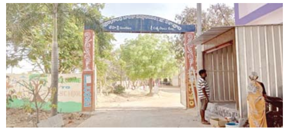
కేజీబీవీ పాఠశాలలో సంప్రదించాలన్నారు.

లేపాక్షి, మేజర్ న్యూస్: లేపాక్షి మండల కేంద్రంలో ఉన్న కస్తూర్బా గాంధీ బాలికల విద్యాలయం నందు 6వ తరగతి, 11వ తరగతి లో ప్రవేశం కోసం అర్హులైన విద్యార్థినులు ఆన్లైన్ లో దరఖాస్తు చేసుకోవాలని ఎస్ఓ నీలిమ శుక్రవారం ఒక ప్రకటనలో తెలిపారు. ఆన్లైన్ లో దరఖాస్తులు ఈనెల 22వ తేదీ నుంచి ఏప్రిల్ 11వ తేదీ వరకు చేసుకోవచ్చున్నారు. అనాథలు, పేద, బడి బయట పిల్లలు, బడి మానేసిన వారు, ఎస్సీ, ఎస్టీ, మైనార్టీ, బిపిఎల్ బాలికలు మాత్రమే దరఖాస్తు చేసుకోవాలని ఆమె పేర్కొన్నారు. రేషన్ కార్డు , ఆధార్ కార్డు, పాస్ ఫోటో, తల్లిదండ్రుల కుల ధృవీకరణ పత్రం, జిరాక్స్ కాపీల తో దరఖాస్తు చేసుకోవాలని తెలిపారు. మరిన్ని వివరాల కోసం