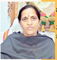
భక్తులకు అన్ని సౌకర్యాలను కల్పిస్తాం

ఆ నామం జపిస్తే చాలు పీడపిశాలకే భయం ఉగాది ఉత్సవం అంతులేని సందరం కసాపురం ఆలయంలో నేటి నుంచి ఉగాది, శ్రీరామనవమి ఉత్సవాలు ప్రారంభం భక్తులతో కిటికీలలాడుతున్న హనుమాన్ ఆలయం స్వామి దర్శనం కోసం 35వేల మంది భక్తులు వస్తున్నట్లు అధికారుల అంచనా గుంతకల్లు అర్చన్, మేజర్ స్వాస్ : గుంతకల్లు మండలంలోని కసాపురం శ్రీ నెట్టికంటి ఆంజనేయస్వామి దేవస్థానంలో శ్రీ విస్వావసునామ తెలుగు సంవత్సర ఉగాది మరియు శ్రీరామనవమి ఉత్సవాలు నేటి నుంచి ఘనంగా ప్రారంభం అవుతున్నాయి. ఇందుకుగానూ ఆలయ అధికారులు భక్తాదుల కోసం అన్ని రకాల ఏర్పాట్లను చేస్తున్నారు. ఆలయంలో జరిగే ఉత్సవ వివరములు : స్వస్థశ్రీ విస్వావసునామ సంవత్సరం చైత్ర శుద్ధ పాడ్యమి అనగా నేటి తెల్లవారుజామున నుంచి మధ్యాహ్నం 12 గంటల వరకు సుప్రభాత సేవ మహోభిషేకం స్వర్ణవజ్రకవచ అలంకరణ విశేష పుష్పాలంకరణ ప్రాతఃకాల అర్చన సుందరకాండ వేద పారాయణములు మధ్యాహ్నం అర్చన మహానీవేదన మహా మంగళహారతి తీర్థ ప్రసాదాలు జరుగుతాయి. అంతేకాకుండా సాయంత్రం పంచాంగ శ్రవణము అనంతరం శ్రీ