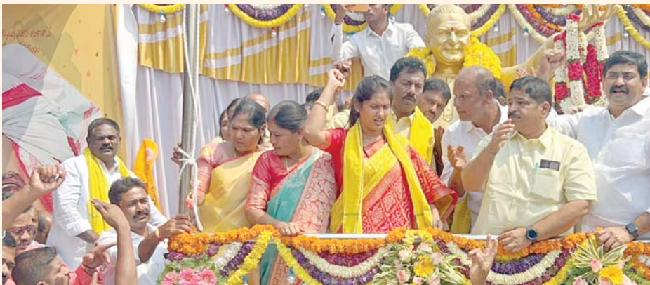
లభించిందన్నారు. అన్న ఎన్టీఆర్ ప్రోత్సాహంతో బడుగులు రాజ్యాధికారంలో భాగస్వామ్యయ్యారన్నారు.