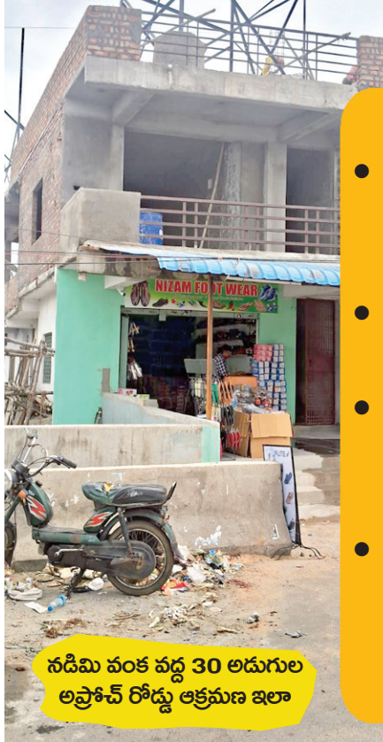
నడిమి వంక వద్ద 30 అడుగుల అప్రోచ్ రోడ్డు ఆక్రమణ ఇలా