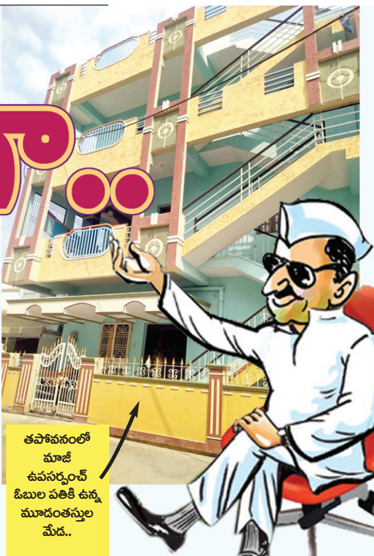
తపోవనంలో మాజీ ఉపసర్పంచ్ ఓబులపతికి ఉన్న మూడంతస్తుల మేడ..

నిలువ నీడ కోసం పేదలు సొంతంటి కలను సాకారం చేసుకునేందుకు జీవితకాలం కప్పవడినా గగనం అవుతుంటే.. మూడంతస్తుల మేడ ఉన్న కోటీశ్వరుడికి రెండు ప్రభుత్వ గృహాలు కట్టబెట్టిన అనంతపురం హౌసింగ్ అధికారులు తమ స్వామి భక్తిని చాటుకున్నారు. అసలు విషయానికొస్తే..