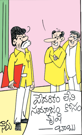
అసలు పేదలు లేని సమాజం కోసం కృషి చేస్తే బాగుంటుంది సార్