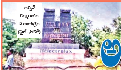
అల్వీన్ కర్మాగారం ముఖచిత్రం (డ్రైల్ ఫోటో)