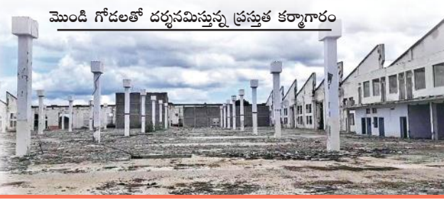
మొండి గోడలతో దర్శనమిస్తున్న ప్రస్తుత కర్మాగారం

సుషంగా ఉన్నది. వందల ఎకరాల ప్రభుత్వ స్థలం లో ఏర్పాటు చేసిన ఈ కర్మాగారం కు గతంలో సుమారుగా 500 పైగా ఉద్యోగుల నివాస స్థలాలు కూడా ఏర్పాటు చేశారు. ఈ కర్మాగారం ఏర్పాటు కోసం గతంలో చాలామంది స్థలాలు కూడా దానం చేయడం జరిగింది అటువంటి కర్మాగారాన్ని నేడు నిర్మాణంగా మారడానికి కారకులు ఎవరు..? రాజకీయ నాయకులు గెలిచిన తర్వాత యువతకు ఉపాధి కల్పిస్తామంటూ కళ్ళ బొల్లి మాటలతో అధికారం వచ్చిన తర్వాత చేతులెత్తేనే ధోరణిలో ప్రవర్తిస్తూ ఉండడం షరా మాములుగా మారింది. డిల్లీ స్థాంలో శాసించగల నాయకులు మన రాజంపేట