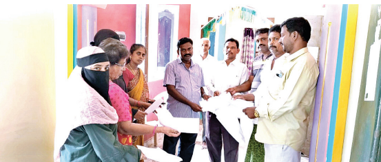
పంచాయతీ కార్యదర్శి వినతి పత్రం ఇస్తున్న ప్రజలు

విషయంపై పంచాయతీ కార్యదర్శి సమాధానం ఇస్తూ ఎవరైతే నివాసిత ప్రాంతాల్లో ప్రజలను ఇబ్బంది కలిగిస్తున్నారు అటువంటి వారిపై తప్పకుండా చర్యలు తీసుకోవడం జరుగుతుందని మొదట వారికి కార్యాలయం నుండి నోటీసులు పంపించి సమాధానం తీసుకున్న తర్వాత దీనిపై తప్పకుండా ప్రజలకు ఆహ్వానంగాగ్నయైన సమాధానాన్ని ఇస్తానని అన్నారు. ఆ ప్రాంతంలో ప్రజలకు ఇబ్బందులు కలగకుండా తగు చర్యలు తీసుకునేందుకు వెంటనే కార్యచరణ అమలువుతుందని ప్రజలకు హామీ ఇచ్చారు.