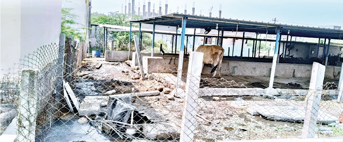
నివాసిత ప్రాంతాల్లో పశువుల వ్యర్థాలు (ఫైల్ ఫోటో)