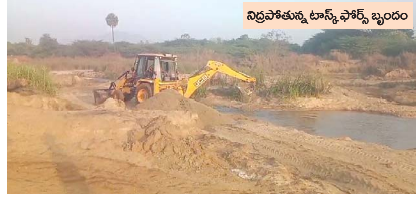
నిద్రపోతున్న ట్యాంక్ ఫోర్స్ బృందం