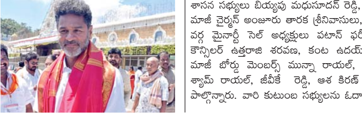
తిరుమల శ్రీ వేంకటేశ్వర స్వామి వారిని దర్శించుకున్న ప్రభుదేవా.

తిరుమల, మేజర్ న్యూస్: తిరుమల శ్రీ వేంకటేశ్వర స్వామి వారిని ప్రముఖ నటుడు కొరి యోగ్రాఫర్, ఇండియన్ మైకేల్ జాక్సన్ ప్రభుదేవా దర్శించుకున్నారు. బుధవారం ఉదయం విబిపీ విరామ సమయంలో కుటుంబ సభ్యులతో కలిసి స్వామి సేవలో పాల్గొని మొ కుల్లు చెల్లించుకున్నారు. దర్శనానంతరం రంగనాయకుల మండపంలో వేదపండితులు వేదాశీర్ష చనం అందించగా ఆలయ అధికారులు శ్రీవారి తీర్థప్రసాదాలు అందజేశారు. ఆలయం వెలుపల ప్రభుదేవా మీడియాతో మాట్లాడుతూ శ్రీవారిని దర్శించుకోవడం చాలా సంతోషంగా ఉందన్నారు. స్వామి దయ అందరిపై ఉండాలని కోరుకున్నట్లు తెలిపారు.