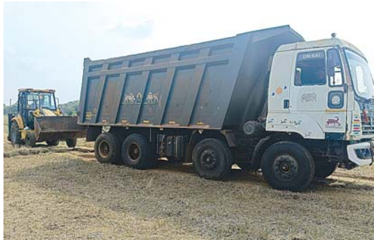
రాయల్ టీలు లేవు. ఈ అక్రమార్కులు చేసిన చట్టం న్యాయం అనిపిస్తుంది.

(మొదటిపేజీ తరువాయి) తలపిస్తున్నాయి. గ్రామస్థాయి నుండి చోటా నాయకుడు నుండి నియోజకవర్గ స్థాయిలో ఉన్న బడా నాయకుడు వరకు అక్రమంగా గ్రావెల్ తవ్వకాలను ఎలాంటి అనుమతులు లేకుండా తవ్వేస్తున్నారు. వీటిని అడ్డుకోవాల్సిన అధికారులే వారికి అండగా నిలిచి అడ్డుకుంటున్న స్థానికులపై బెదిరింపులు చేస్తున్నారని పలు వురు విమర్శిస్తున్నారు. గ్రావెల్ తరలింపడానికి రీచీలు ఎక్కడ ? నిబంధనలేవీ... గ్రావులను తరలించాలంటే ప్రభుత్వం నుండి అనుమతులు కచ్చితంగా తీసుకోవాలి. దీనికి తోడు ఒక ప్రాంతం నుండి మరొక ప్రాంతానికి గ్రావుల్ తరలింపడానికి ప్రభుత్వానికి రాయల్టీ కట్టాలి. కానీ దారవారి సత్రం మండలంలో మాత్రం ఎలాంటి అనుమతులు లేవు, ఎలాంటి