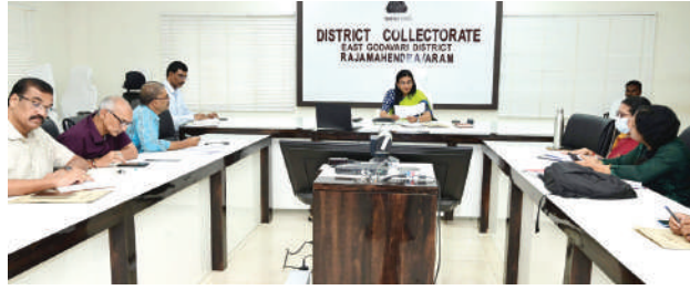
-ఐస్ ఫ్యాక్టరీలను తనిఖీ చేయండి - కలక్టర్