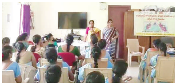
పెద్దాపురం, మేజర్ న్యూస్ : పోషణ బి పోషణ పథామ్ కార్యక్రమం ద్వారా దేశంలోని పిల్లలందరకు మంచి చదువు మంచి