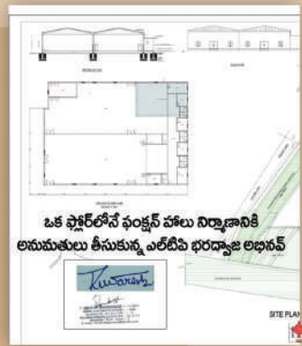
ఒక ఫ్లోర్లోనే ఫంక్షన్ హాలు నిర్మాణానికి అనుమతులు తీసుకున్న ఎల్.బి.భరద్వాజ అభినవ్