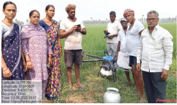
వాలంటీర్లైన తమపై మోపుతున్నారని వారు పాపోతున్నారు. ఒకవైపు డ్రోన్ లద్వారా కషాయాలు ద్రావణాలు పిచికారి చేయించాలని ప్రతి రైతును ఒప్పించాలని తమకు టార్గెట్లు ఇస్తూ తమను మానసికంగా వేధిస్తున్న అధికారులు ఇప్పుడు అప్పులు చేసి నవధాన్యాలతో కూడిన 30 రకాల చిరుధాన్యాలను కిట్లుగా తయారుచేసి రైతులకు ఇవ్వమనటం ఎంతవరకు సబబు అని వాటికొరకు అప్పులు చేస్తే తాము ఆ అప్పు తీర్చేదెలా తమ కుటుంబాలను పోషించుకునేదెలా అని వారు ఆవేదన వ్యక్తం చేస్తున్నారు.

గతంలో వ్యవసాయ శాఖ ద్వారా నవధాన్యాల టార్పాలిన్లు వ్యవసాయదారులకు సబ్సిడీ రేట్లపై ఇచ్చేవారని అదేవిధంగా ఇప్పుడు ప్రభుత్వం ద్వారా ఈ కిట్లు వాటికి సంబంధించిన విత్తనాలు తమకు అందిస్తే తాము క్షేత్రస్థాయిలో వ్యవసాయదారులకు అందించి అధికారుల ఆందోళకు అనుగుణంగా పనిచేయగలమని అంతేగాని తాము అప్పు చేసి ఈ కిట్లను సరఫరా చేయలేమని వారు ఆవేదన వ్యక్తం చేశారు. సిబ్బంది కొరత ఉన్నప్పటికీ ఖరీఫ్ యాక్షన్ ప్లాన్ లో భాగంగా ప్రకృతి వ్యవసాయం చేసే రైతులను గుర్తించే సర్వేను కూడా తమకే అప్పగించారని నామమాత్రం గౌరవ వేతనంతో తమను వెట్టిచాకిరి చేయిస్తున్నారని వారు ఆవేదన వ్యక్తం చేశారు. ఇటీవల కాలంలో పని గంటలు నిర్ధారించడానికి ఉదయం సాయంత్రం లింక్ ద్వారా అటెండెన్స్ వేయమంటున్నారని ఎనిమిది గంటలు పని చేయాలని నిర్ధారించిన అధికారులు తమకు కనీస వేతనం ఇవ్వాలనే ఆలోచన ఎందుకు రాలేదో చెప్పాలన్నారు. కనీస వేతనం ఇవ్వాలని తమను ద్వితీయ శ్రేణి పౌరులుగా చూడకుండా తమను మనుషులుగా గుర్తించి తమకు కనీస వేతనం, వేతనంతో కూడిన సెలవుల సౌకర్యం కల్పించాలని వారు డిమాండ్ చేశారు. ఇప్పటికైనా ప్రజాప్రతినిధులు, అధికారులు ప్రకృతి వ్యవసాయ వాలంటీర్ గోడు పట్టించుకుని వారికి న్యాయం చేయాలని రైతులు కోరుతున్నారు.