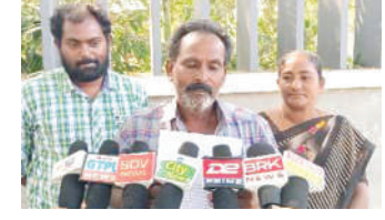
కాకినాడ, మేజర్ న్యూస్ : ప్రభుత్వ ఉద్యోగం ఇప్పిస్తామంటూ నమ్మబలికి డబ్బులు కాజేసిన వ్యక్తులపై చర్యలు తీసుకుని తమకు న్యాయం చేయాలని కోరుతూ ప్రతిపాడు మండలం