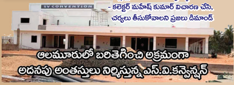
ఆలమూరులో బరితెగించి అక్రమంగా అదనపు అంతస్తులు నిర్మిస్తున్న ఎన్.వి.కన్వెన్షన్