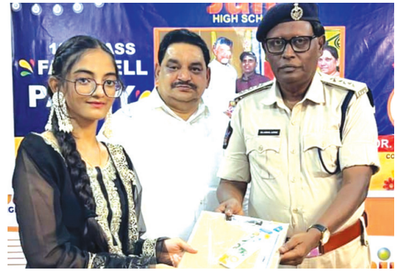
గుంటూరు, రూరల్ మేజర్ స్కూస్:

▶▶ ఆత్మస్థైర్యంతో పరీక్షలు రాయండి ▶▶ జైన్ హై స్కూల్ ఫీర్ వెల్ వేడుకలో ఈస్ట్ డివిస్యన్ అబ్జర్వ్ అజీజ్