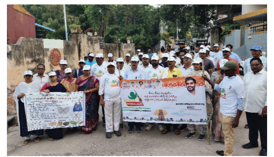
మంగళగిరి మేజర్ స్కూల్స్ :

ఈ కార్యక్రమం ద్వారా 30 రోజుల పాటు అన్ని సచివాలయాల పరిధిలో పూర్తి స్థాయిలో చెత్త తొలగింపు ప్రతి ఇంటింటికీ వెళ్లి పారిశుధ్యంపై అవగాహన కల్పించనున్న నగరపాలక సిబ్బంది