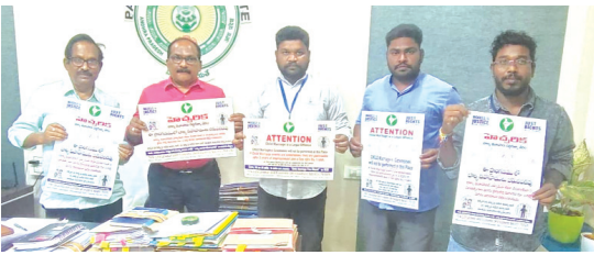
నరసరావుపేట మేజర్ న్యూస్ :