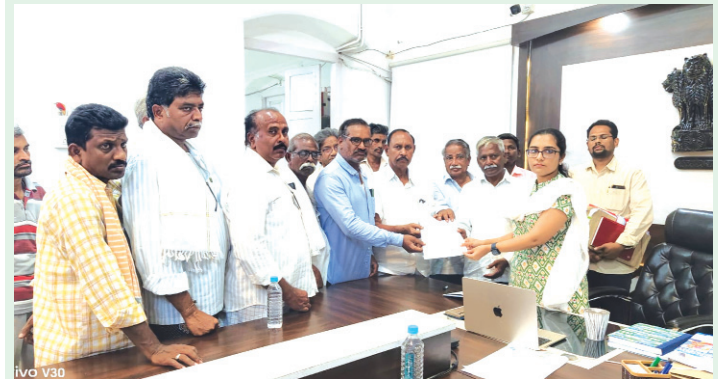
తెనాలి, మేజర్ స్కూల్స్