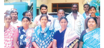
నరసరావుపేట మేజర్ న్యూస్ :

పల్నాడు మున్సిపల్ వర్కర్స్, ఎంప్లాయిస్ యూనియన్