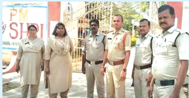
పిడుగురాళ్ల మేజర్ న్యూస్ :