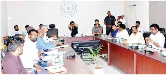
తాగునీటికి ఇబ్బంది లేకుండా చూడండి అధికారులను ఆదేశించిన ఎమ్మెల్యే కలెక్టర్

నరసరావుపేట, మేజర్ న్యూస్ : జిల్లాలో రబీ సీజన్ కు సంబంధించి సాగు నీరు అందని కారణంగా సెంటు భూమిలో పంట సైతం ఎండకుండా జాగ్రత్తలు తీసుకోవాలని జిల్లా కలెక్టర్ అధికారులను ఆదేశించారు. మండల వ్యవసాయ అధికారులు ఎప్పటికప్పుడు తమ పరిధిలో రైతుల అవసరాలకు తగ్గట్టు నీరు అందేలా చూడాలన్నారు. మండల స్థాయిలో కరవు పర్యవేక్షణ సెల్ ప్రారంభించాలన్నారు. పంచాయతీ నిధులతో గ్రామాల్లో తాగు నీటి సరఫరా చేయాలన్నారు. అన్ని ప్రభుత్వ కార్యాలయాల్లో సందర్శకులకు తాగు నీటి సౌకర్యం కల్పించాలన్నారు. స్థానిక కలెక్టరేట్ లోని ఎస్సార్ శంకరన్ వీడియో కాన్ఫరెన్స్ హాలులో సర్వేలు, ప్రభుత్వ పథకాల అమలుపై సమీక్ష సమావేశం నిర్వహించారు. సమావేశంలో జిల్లా కలెక్టర్ మాట్లాడుతూ జిల్లాలో పీ-4 సర్వే 95 శాతం, వర్క ప్రం హెం 45 శాతం పూర్తయ్యాయన్నారు. జిల్లా ప్రజల చేత అభివృద్ధికి సూచనలు చేసే పీ-4 కన్వల్యూషన్ సర్వేలో పెద్ద ఎత్తున ప్రజలు పాల్గొనేలా చూడాలన్నారు. మార్చి నెలాఖరు లోగా రైతు రిజిస్ట్రేషన్లు 60 శాతం పూర్తి చేయాలన్నారు. ఈ నెలలో రెండు దఫాలుగా ఆధార్ క్యాంపులు