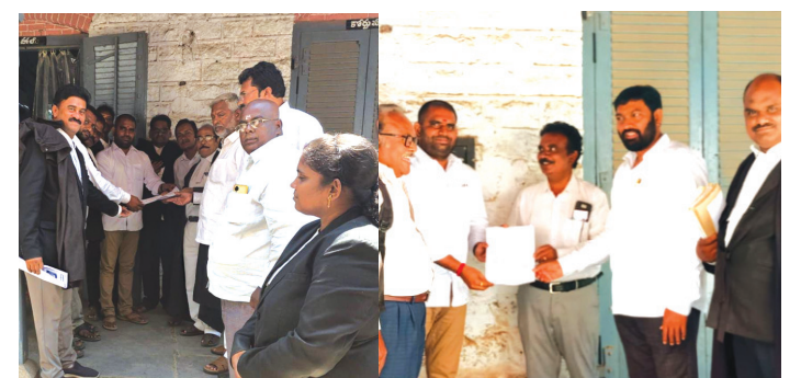
సత్తెనపల్లి మేజర్ స్కూల్స్:

ప్రెసిడెంట్ గా పోటీ పడుతున్న రెండు వర్గాలకు చెందిన ఇద్దరు న్యాయవాదులు ఎందకు మించి కాక రేపుతున్న బార్ ఎన్నికలు ఎత్తులు, పై ఎత్తులతో ప్రచారం