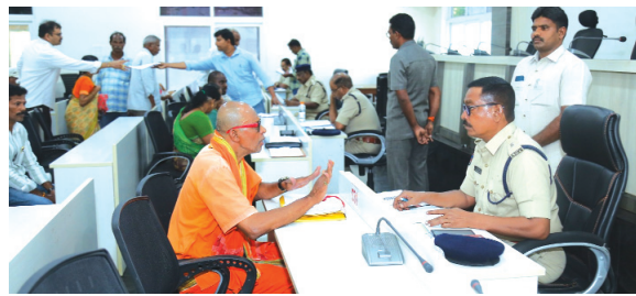
గుంటూరు జిల్లా నేటి దినపత్రిక సూర్య బ్యూరో: