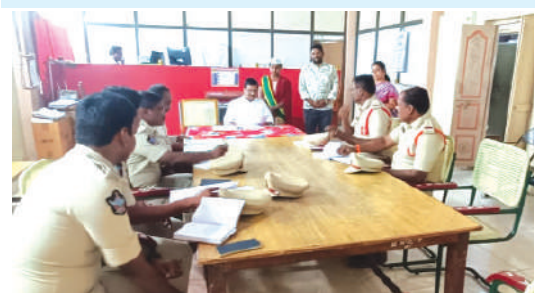
సత్తెనపల్లి మేజర్ స్పూస్: