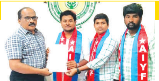
నరసరావుపేట రూరల్, మేజర్ న్యూస్: