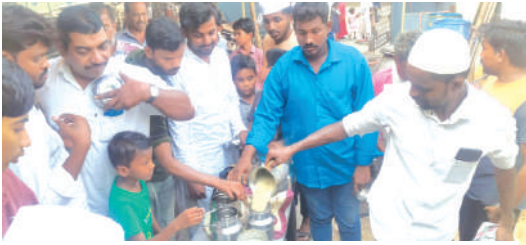
మంగళగిరి అంజుమన్ కార్యాలయం వద్ద గంజిని పంపిణీ చేస్తున్న దృశ్యం..

-రంజాన్ నెలలో గంజికి ఎంతో ప్రాధాన్యత -ఉపవాస దీక్షాధారులకు బలవర్ధక ఆహారంగా గంజి -దాతల సహకారంతో మసీదుల వద్ద గంజి పంపిణీ