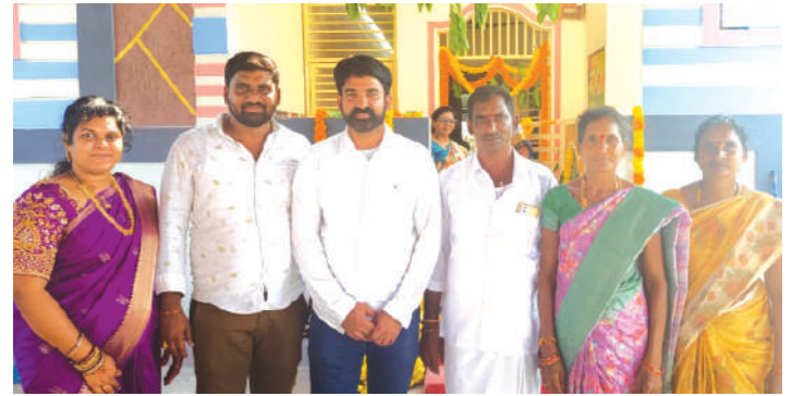
నకరికల్లు, మేజర్ న్యూస్ :