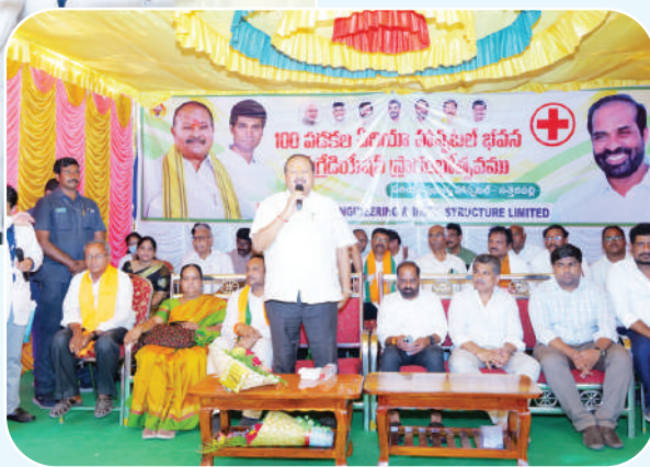
ప్రభుత్వ ఆసుపత్రులలో పేదలకు కార్పొరేట్ స్థాయి వైద్యం అందించేందుకు