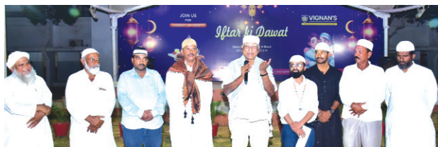
చేట్రోలు, మేజర్ న్యూస్