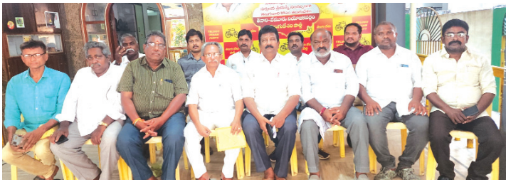
తెనాలి, మేజర్ స్టూన్స్

- ఆలపాటి శివరామకృష్ణయ్య మెమోరియల్ ఆధ్వర్యంలో నిర్వహణ