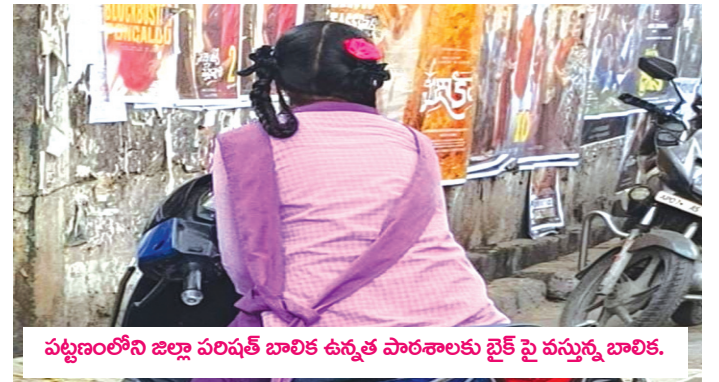
పట్టణంలోని జిల్లా పరిషత్ బాలిక ఉన్నత పాఠశాలకు బైక్ పై వస్తున్న బాలిక.

సత్తెనపల్లి క్రిం,మేజర్ న్యూస్: మైనర్ల డ్రైవింగ్..ర్యాష్ డ్రైవింగ్ ఇటీవల కాలంలో తీవ్ర ఆందోళన కలిగిస్తున్న విషయం. రాంగ్ రూల్స్ లో వెళ్ళటం,ఓవర్ టేక్ చేయటం ఇప్పటి కుర్రకారుకి ఫ్యాషన్ అయింది. ఇష్టారాజ్యంగా రోడ్లపై స్పీడ్ గా డ్రైవ్ చేస్తూ వాహనదారులను, పాదాచారులను భయభ్రాంతులకు గురిచేస్తున్నారు. మితిమీరిన వేగంతో వెళ్ళూ ప్రమాదాలకు గురవుతున్నారు.తల్లిదండ్రులకు కడుపుకోత మిగుల్చుతూ ప్రాణాలు కోల్పోతున్నారు.ఇంట్లో తల్లిదండ్రులు పట్టించుకోకపోవడమో, తమను ఎవరూ ఏమీ చేయలేరనే అహంకారమో గాని రోడ్డు మీద రూల్స్ పాటించటం లేదు. ఇష్టారీతిన వాహనాలు నడుపుతూ ప్రమాదాలకు కారణమవు తున్నారు.స్కూల్ పిల్లలకు, మైనార్లీ తీరిని యువకులకు తల్లిదండ్రులు ద్విచక్ర వాహనాలు ఇవ్వటమే ఈ ప్రమాదాలకు ప్రధాన కారణంగా చెప్పవచ్చు.ఇటీవల పట్టణంలో మహాశివరాత్రి రోజున ఉదయం అతివేగంతో డ్రైవ్ చేసి ఇద్దరు మైనర్లు మృతి చెందిన ఘటనను ఉదాహరణగా తీసుకోవచ్చు.నాలుగు రోజుల క్రితం ఓ వ్యక్తి మరొకరికి కారు డ్రైవింగ్ నేర్పుతూ పాత శివాలయం మలుపు వద్ద దాదాపు పది వాహనాలను ఢీ కొట్టాడు. ఆ సమయంలో వృద్ధులు, స్థానికులు హడలిపోయారు.ముఖ్యంగా 10 నుంచి 15 ఏళ్ల మధ్యలో గల స్కూలు విద్యార్థులు సైతం పాఠశాలకు బైక్ పై వెళుతుండటం ఆందోళన కలిగించే విషయం.