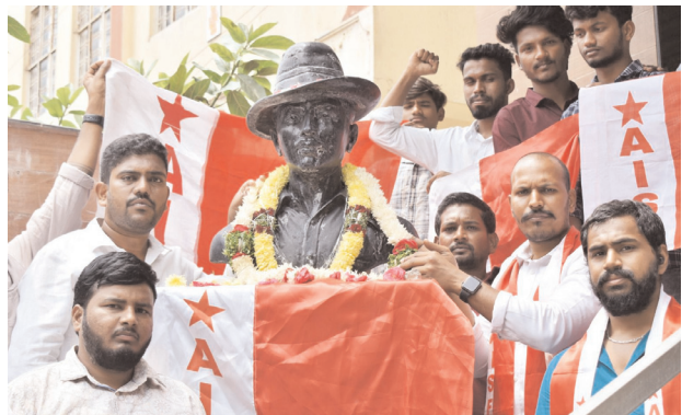
హిమాయత్ నగర్, మేజర్ న్యూస్ : ఐఎస్ఎఫ్ రాష్ట్ర సమితి అధ్యక్షులలో భగత్ సింగ్, రాజ్ గురు, సుఖ్ దేవ్ ల 94వ వర్షాంతి సందర్భంగా రామ్ కోటిలోని భగత్ సింగ్, రాజ్ గురు, సుఖ్ దేవ్ చిత్రపటాలకు ఆదివారం పూలమాల వేసి