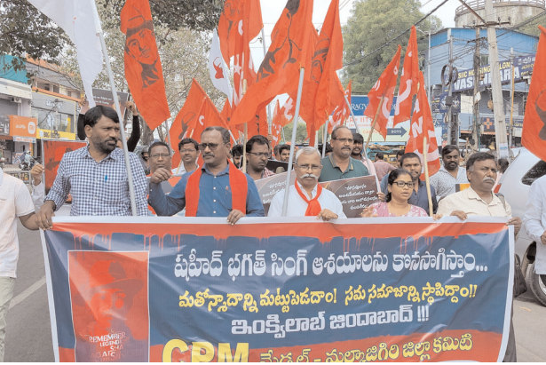
కాప్రా : (మేజర్ న్యూస్) : నేటి యువతరం భగత్ సింగ్ ఆశయా సాధనకు కృషి ఎక్కి చెయ్యాలని అవసరం ఎంతైనా ఉందని మేధుల్ మల్కాజ్గిరి జిల్లా సిపిఎం