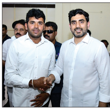
వారి అభివృద్ధికి ప్రణాళికబద్ధంగా కృషి చేసేందుకు ఎల్లప్పుడూ నియోజకవర్గం ప్రజా సమస్యలపై స్పందించి సమస్యల పరిష్కారం కోసం అహర్నిశలు కృషి చేస్తానని యువ మంత్రి హామీ ఇచ్చారని ఆయన తెలిపారు.