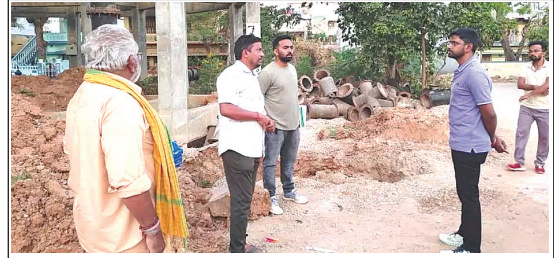
పనులను పరిశీలిస్తున్న అధికారులు (ఫైల్ ఫోటో)

మంచినీటిని పంపింగ్ చేయడానికి 59 కిలోమీటర్ల డిస్ట్రిబ్యూషన్ పైప్ లైన్ వేయాల్సి ఉండగా, 57 కిలోమీటర్ల మేర పనులు పూర్తయ్యాయి. రెండు కిలోమీటర్ల మేర పనులు పెండింగ్ లో ఉన్నాయి. పూర్తయిన పైప్ లైన్ కు సంబంధించి పరిక్షలు కూడా నిర్వహించలేదు. పెన్నా నది నుంచి వచ్చే పైప్ లైన్ ద్వారా ఓవర్ హెడ్ ట్యాంకులను నింపి అక్కడ నుంచి ప్రత్యేక డిస్ట్రిబ్యూషన్ లైన్లను వేసి నగరంలోని ప్రతి ఇంటికి మంచినీటి కనెక్షన్ ఇచ్చి నీటిని సరఫరా చేయాలన్నది పథకం లక్ష్యం. కానీ నేటికీ 63 శాతం పనులు మాత్రమే పూర్తయినట్లు తెలుస్తోంది.