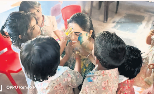
చేసుకోవడానికి ఆమెను పూజించి ఉత్సాహం చేయమని ఆదేశించేవాడని ఓ కథలో ఉంది. హెహాలీ రోజు ఒకరిపై ఒకరు రంగులు చల్లుకోవడం వల్ల సాభాగ్యాలు ప్రేమలు వెల్లివిరిసి అనుబంధాలు బలపడతాయని ప్రగాఢ విశ్వాసం.

శ్రీకృష్ణుడు బృందావనంలో గోపికలతో రంగులు, తీరొక్కపూలతో హెహాలీ జరుపుకున్నట్లు పురాణాల్లో ఉంది. అదేవిధంగా శ్రీరాముడు తన రాజ్యంలోని పసివారిని హెహాలీకా అనే రాక్షసి సంహరించేదని ఆమెను ప్రసన్నురాలని