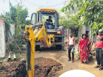
సమస్యను సూర్య దినపత్రిక లో ప్రచురించినందుకు సూర్య విలేఖరి కి కృతజ్ఞతలు తెలిపారు.