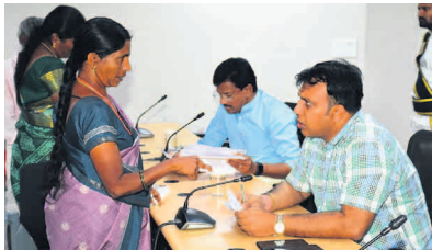
కల్పన శాఖకు 6, జిల్లా సంక్షేమ అధికారికి 5, విద్యాశాఖ కు 4, సర్వే శాఖ, చందూర్కి ఎంపీడీఓ కార్యాలయం, ఎస్సీసీకి మూడు చొప్పున, నీటి పారుదల శాఖ, వేములవాడ మున్సిపల్, సెస్ కార్యాలయానికి రెండు చొప్పున, కార్మిక శాఖ,

ప్రజావాణిలో వచ్చే అర్జీలకు సకాలంలో పరిష్కారం చూపాలని కలెక్టర్ సందీప్ కుమార్ ఝా ఆదేశించారు. జిల్లా సమీకృత కార్యాలయాల సమదాయంలోని ఆడిటోరియంలో సోమవారం ప్రజావాణి నిర్వహించి, ప్రజల నుంచి దరఖాస్తులను కలెక్టర్, అదనపు కలెక్టర్ ఖీమ్మా నాయక్ స్వీకరించారు. ఈ సందర్భంగా కలెక్టర్ సందీప్ కుమార్ ఝా అర్జీలు తీసుకుని సంబంధిత అధికారులకు ఆదేశాలు జారీ చేశారు. ప్రజావాణి కార్యక్రమంలో రెవెన్యూ శాఖకు 49, సిరిసిల్ల మున్సిపల్ కు 11, ఉపాధి