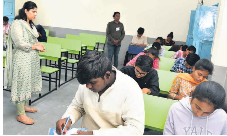
దృష్ట్యా ఓఆర్ఎస్ ప్యాకెట్లు, అత్యవసర మందులు అందుబాటులో ఉంచాలన్నారు. ఎలాంటి మాల్ ప్రాక్టీసుకు అవకాశం ఇవ్వకుండా పకడ్బందీగా