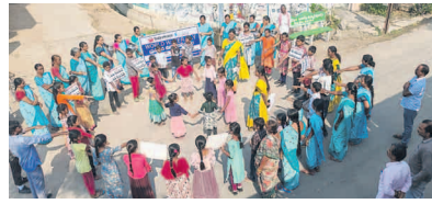
కల్పించారు. అనంతరం విద్యార్థులు, మహిళలు