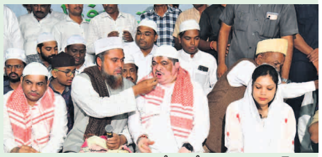
సమాజం బాగుండాలన్న కోరికతో పవిత్ర రంజాన్ మాసంలో ముస్లింలు ఉపవాసం (మిగతా 2లో)