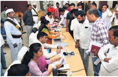
వ్యయ ప్రయాసలతో ఇక్కడికి వస్తున్న వారి ధరఖాస్తులను వీలైనంత త్వరగా పరిష్కరించాలని అన్నారు. సంబంధిత అధికారులు శాఖల వారిగా

ప్రజావాణి కార్యక్రమంలో వచ్చే ధరఖాస్తులకు అధిక ప్రాధాన్యత ఇచ్చి త్వరితగతిన పరిష్కరించాలని జిల్లా కలెక్టర్ పమేలా సత్యతి సంబంధిత అధికారులను ఆదేశించారు. సోమవారం కలెక్టరేట్ ఆడిటోరియంలో నిర్వహించిన ప్రజావాణి కార్యక్రమంలో ప్రజల నుండి ఫిర్యాదులు, వినతులను అదనపు కలెక్టర్ తో కలిసి కలెక్టర్ స్వీకరించారు. ఈ సందర్భంగా కలెక్టర్ మాట్లాడుతూ సమస్యల పరిష్కారం కోరుతూ ప్రజలు ప్రజావాణి ఆశ్రయిస్తున్నారని, ఎన్నో