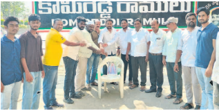
కోనీ కార్వన్ మొక్కలపై ప్రభుత్వ నిర్ణయం హార్షణీయం