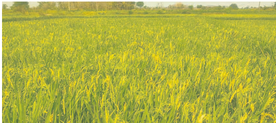
సూచనలు ఇవ్వాలని చిలుక స్వామి పల్లె బాలయ్య పలువురు రైతులు కోరుతున్నారు.

తీసుకొచ్చి ఎన్నిసార్లు పిచికారి చేసినా ఉధృతి తగ్గడం లేదని రైతులు దిగులు చెందుతున్నారు. వరి పంటకు తెగులు సోకి ఆందోళన చెందుతుంటే వ్యవసాయ అధికారులు అటువైపు కన్నెత్తి చూడడం లేదని పలువురు రైతులు ఆరోపిస్తున్నారు. వ్యవసాయ అధికారులు స్పందించి పంట బొలాలను పర్యవేక్షించి తగు