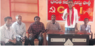
సిరిసిల్లలో సిపిఐ నాయకుల అరెస్ట్