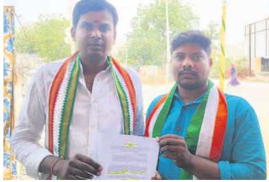
మంత్రి పోస్టు ప్రభాకర్ గౌడ్ , రామగుండం ఎమ్మెల్యే రాజ్ రాగూర్ , యువజన కాంగ్రెస్ పార్టీ ప్రత్యేక కృతజ్ఞతలు తెలుపుతూ ఆనాడు 2008లో కాంగ్రెస్ పార్టీ ఉమ్మడి రాష్ట్రం లో

సూర్య యొటింకైన్ కాలనీ ఉమ్మడి కరీంనగర్ జిల్లా లో శాతవాహన విశ్వవిద్యాలయకు అనుబంధంగా యూనివర్సిటీ లా కాలేజీ, యూనివర్సిటీ ఇంజనీరింగ్ సాంకేతిక కళాశాల అనుమతి ఏర్పాటుకు సంబంధిత జీవో 18,19 విడుదల చేసిన తెలంగాణ రాష్ట్ర ప్రభుత్వం రాష్ట్ర ముఖ్యమంత్రి రేవంత్ రెడ్డి, ఉప ముఖ్యమంత్రి భట్టి విక్రమార్కు మల్లకి, యూనివర్సిటీకి లా కళాశాలకు 23 కోట్లు మొదటి సంవత్సరం 60 సీట్లతో, ఇంజనీరింగ్ కళాశాలకు 44 కోట్లు ఒక్కటే 60 సీట్లు మంజూరు కృషి చేసిన ఉమ్మడి జిల్లా ఐటీ శాఖ మంత్రి శ్రీధర్ బాబు , బి సీ రవాణా శాఖ