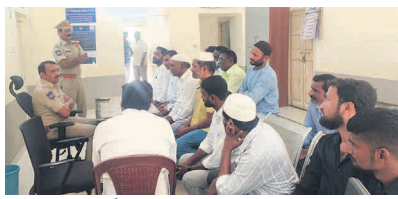
మతాలకు అతీతంగా జరుపుకుంటూ పలువురికి ఆదర్శంగా నిలవాలన్నారు. గతంలో మాదిరిగానే కుల, మతాలతో సంబంధం లేకుండా పండుగలు జరుపుకోవాలని అన్నారు. పండుగల సమయంలో పోలీసులు ఎలాంటి అవాంఛనీయ సంఘటనలు జరగకుండా జాగ్రత్తలు తీసుకుంటామని అన్నారు. పండుగల సమయంలో ప్రజలకు