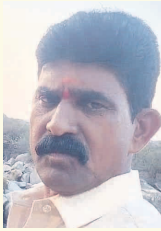
- చేపాల ప్రభాకర్ గంభీరావుపేట

వెంకటాద్రి, ఆలుమగల చెరువులు పూర్తిగా కలుషితమవుతున్నాయి. చెత్త చెదారం ఇండ్ల నుండి వెలువడే కలుషిత నీరు చెరువులో చేరకుండా అధికారులు చర్యలు తీసుకోవాలి. అధికారులు ఇప్పటికైనా చర్యలు తీసుకోకుంటే భవిష్యత్తులో మరింత నష్టం జరుగుతుంది.