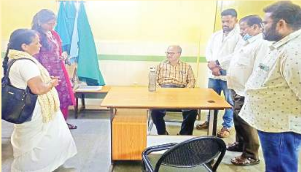
జూలూరుపాడు, సూర్య (మేజర్ న్యూస్)

-దుల పట్ల నిర్లక్ష్యం వహించిన సిబ్బందికి నోటీసులు