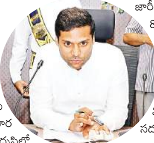
ఖమ్మం (సూర్య బ్యూరో):

జిల్లా కలెక్టరేట్ కు వివిధ పనుల నిమిత్తం వచ్చే దివ్యాంగులకు ఉచిత భోజన సదుపాయాన్ని మార్చి 5వ తారీఖు నుంచి కల్పించనున్నట్లు జిల్లా కలెక్టర్ ముజమ్మిల్ ఖాన్ సోమవారం ఒక ప్రకటనలో తెలిపారు. దివ్యాంగులు తమ సమస్యల పరిష్కారం, వివిధ పనుల కోసం సుదూర ప్రాంతాల నుంచి జిల్లా కలెక్టరేట్ కు వస్తున్నారనే అంశం దృష్టిలో ఉంచుకొని పని దినాలలో వారికి కలెక్టరేట్ క్యాంటీన్ నందు మధ్యాహ్నం ఉచిత భోజన వసతి కల్పించాలని నిర్ణయించామని అన్నారు. అన్నం, ఆకు కూర పప్పు, రోటి, వచ్చడి, 2 కూరలు, సాంబారు/రసం, పెరుగుతో మంచి భోజనం దివ్యాంగులకు అందించేందుకు ఏర్పాటు చేస్తున్నట్లు తెలిపారు. కలెక్టరేట్ నందు ఉన్న వివిధ కార్యాలయాలకు కూపన్ను పంపడం జరుగుతుందని, 40 శాతం వైకల్యం గల దివ్యాంగులకు వీటిని