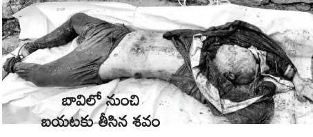
బావిలో నుంచి బయటకు తీసిన శవం

అస్పరి, మేజర్ న్యూస్ : అస్పరి మండల కేంద్రంలో ఉన్న పెద్ద బావిలో గుర్తు తెలియని శవం లభ్యమైందని స్థానికులు తెలిపారు. ఆదివారం స్థానికులు పోలీసులకు అందించిన సమాచారం మేరకు వివరాలు ఇలా ఉన్నాయి. సిబి మస్సాన్ వలి ఘటనా స్థలానికి చేరుకొని మృతదేహాన్ని పరిశీలించారు. బావి చుట్టు ప్రక్కల ఆనవాళ్ల కోసం వెతుకుతున్నారు. కేసు నమోదు చేసుకొని ధర్యాప్తు చేస్తున్నట్లు సిబి తెలిపారు.