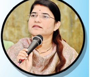
మాట్లాడుతున్న నంద్యాల కలెక్టర్