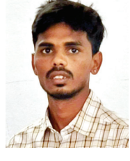
మాగ్గం కావాలని ఆయన అభిలాషించారు.