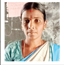
అంగన్వాడీ-02 టీచర్ రోజుక

సి.బెళగల్ మండలం కే. సింగవరం గ్రామంలో అంగన్వాడీ సెంటర్లు శిథిలావస్థకు చేరుకున్నాయి. గ్రామంలో రెండు అంగన్వాడీ సెంటర్లు నిర్వహిస్తున్నారు. ఈ సెంటర్లకు సొంత భవనాలు లేక పురాతన స్కూల్ భవనంలో నిర్వహిస్తున్నారు. ఈ భవనం పురాతన భవనం గతంలో గ్రామం మొత్తం భారీ వరదలు సభవించిన సమయంలో గ్రామం పూర్తిగా వరద నీటిలో మునిగి అనేక ప్రాణ నష్టం, ఆస్తి నష్టం సంభవించింది. అదే సమయంలో ఈ భవనంకూడా వరద నీటితో మునిగి ఇప్పటికీ నీటి నెమ్మతో పై కప్పు పచ్చి లూడిన ఆనవాలు కనిపిస్తున్నాయి. పురాతన భవనం కావడంతో ఎప్పుడు ఏమి విపత్తు సంభావిస్తుందోనని అంగన్వాడీ సిబ్బంది, 65మంది పిల్లలు భయంతో కాలం నెట్టుకొస్తున్నారు. ఎస్సీ కాలనీలో గత పది పదిహేను సంవత్సరాల క్రితం నూతన భవనం నిర్మించి మధ్యలో ఆపేశారు. నిర్మాణం మధ్యలో ఎందుకు ఆగిందో సంబంధిత శిశు సంక్షేమ అధికారులు, మండల అధికారులకు తెలియదాని. ప్రభుత్వాలు మారుతున్నాయి, అధికారులు మారుతున్నారు. కానీ గ్రామంలో అంగన్వాడీ సెంటర్ల దుస్థితి మారడం లేదు. ఇప్పటికైనా 65మంది పిల్లల బంగారు భవిష్యత్తును దృష్టిలో పెట్టుకొని వారికి ప్రమాదం జరకమునుపే వారి ప్రాణాలకు రక్షణ, భవిష్యత్తు కోసం నూతన అంగన్వాడీ భవన నిర్మాణాలు చేపట్టాలని, లేదా అద్దె భవనాలు ఏర్పాటు చేయాలని ప్రజలు కోరుతున్నారు. రోజుకోయుగంలా గడుతున్నాము రోజుక రోజుకో యుగంలా గడుతున్నామని, ఇదే సమస్యను మండల అధికారులకు పలు మార్లు విన్నవించు కున్నామని అయినా ఫలితం లేదని తెలిపారు. ఇప్పటికైనా 65మంది పసి పిల్లల ప్రాణాలకు భద్ర దృష్ట్యా నూతన భవనాలు నిర్మించాలని లేదా అద్దె భవనాలను సూచించాలని అంగన్వాడీ -02 టీచర్ రోజుక కోరారు.