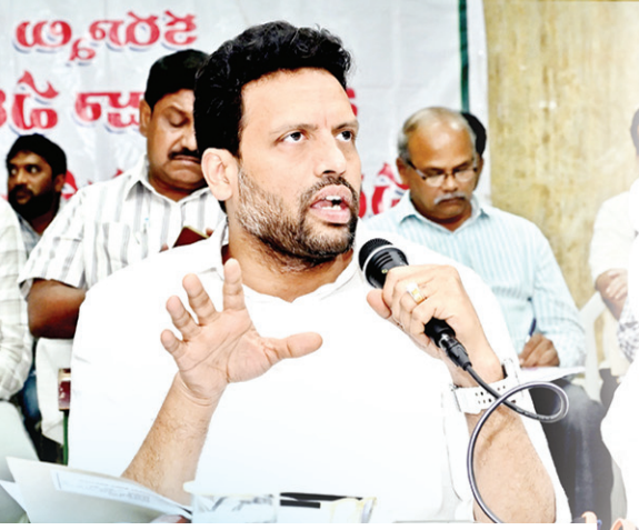
సమావేశంలో మాట్లాడుతున్న మంత్రి టీజీ భరత్