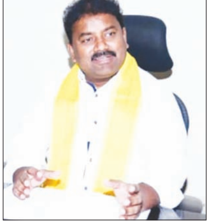
బడ్జెట్ను రూపొందించిన ముఖ్యమంత్రి నారా చంద్రబాబు నాయుడు, ఉపముఖ్యమంత్రి పవన్ కళ్యాణ్, ఆర్థిక శాఖ మంత్రి పర్యూవుల కేశవ్ లకు ఈ సందర్భంగా ఎమ్మెల్యే కుమార్ రాజు కృతజ్ఞతలు తెలిపారు.

బడ్జెట్ ఉందన్నారు. మధ్య తరగతి, కింద తరగతి ప్రజల పిల్లలు చదువుకునే పాఠశాలలకు ఉచిత విద్యుత్తు అందించడం ద్వారా మెరుగైన విద్యా ఫలితాలను సాధించే అవకాశం ఏర్పడుతుందన్నారు. అలాగే తల్లికి వం దనం పథకానికి ప్రత్యేకంగా నిధులు కేటాయించి ఎంత మంది చదువుకునే పిల్లలు ఉన్నా అందరికీ 15వేల రూపాయల వంతున వచ్చే విద్యా సంవత్సరం నాటికి వేసేందుకు తగిన ప్రణాళికతో కేటాయింపులు చేయడం అభినందనీయమన్నారు. తమ ప్రభుత్వం రైతులకు ఇచ్చే ప్రాధాన్యత క్రమంలో భాగంగా అన్నదాత సుఖీభవ పథకానికి ప్రత్యేకంగా నిధులు కేటాయించి రైతులపై తమకు ఉన్న ప్రేమను తమ ప్రభుత్వం చాటుకుందన్నారు. మహిళలకు దీపం 2 పథం కింద ఉచితంగా మూడు గ్యాలన్ సిలిండర్లు అందించేందుకు కూడా ప్రత్యేకంగా నిధులను కేటాయించడం తమ మంచి ప్రభుత్వానికి తగిన గుర్తింపుగా ఉందన్నారు. రాష్ట్రంలోని అన్ని వర్గాల ప్రజల సంక్షేమమే లక్ష్యంగా ఈ