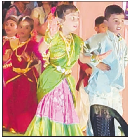
రకాల ఆటలు పోటీల్లో శిక్షణను ఇచ్చిన పిల్లలను మెమెంటోలతో సత్కరించారు. సాంస్కృతిక కార్యక్రమంలో

గుడ్లపల్లెరు మేజర్ న్యూస్ : స్థానిక గుడ్లపల్లెరు