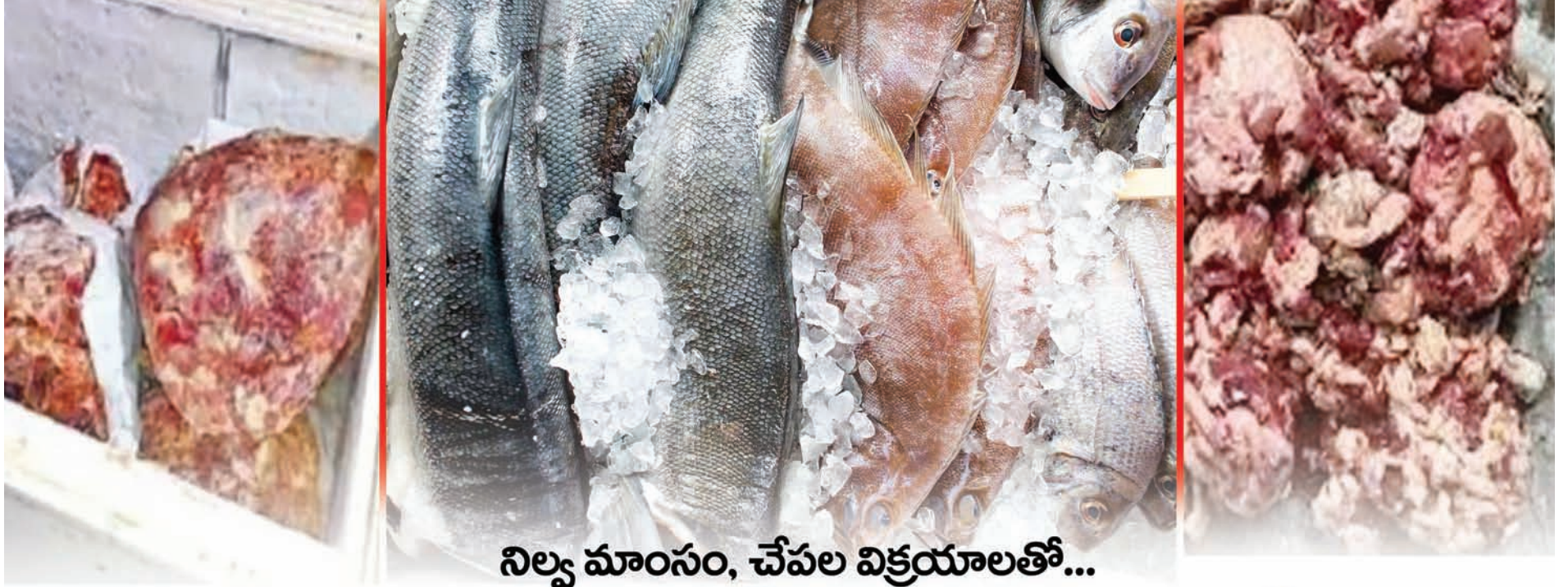
నిల్వ మాంసం, చేపల విక్రయాలతో...