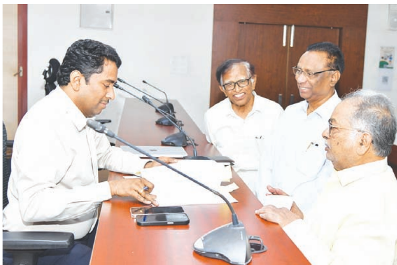
ఎన్టీఆర్ జిల్లా బ్యూరో, మార్చి 11, మేజర్ స్ట్యాన్ : దశాబ్దాల చరిత్ర ఉన్న కృష్ణా పారిశ్రామిక, వ్యవసాయ ఎగ్జిబిషన్ సొసైటీకి పూర్వ వైభవం తెచ్చేందుకు కృషి