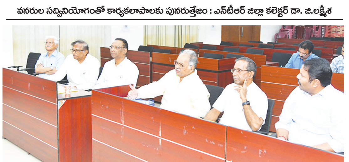
వనరుల సద్వినియోగంతో కార్యకలాపాలకు పునరుత్తేజం : ఎన్టీఆర్ జిల్లా కలెక్టర్ డా. జి.లక్ష్మీశ

చేయడం జరుగుతుందని, సొసైటీ కార్యకలాపాలకు జవ సత్కాలు తెచ్చేందుకు సమగ్ర కార్యాచరణ అవసరమని జిల్లా కలెక్టర్ డా. జి.లక్ష్మీశ అన్నారు. మంగళవారం కలె