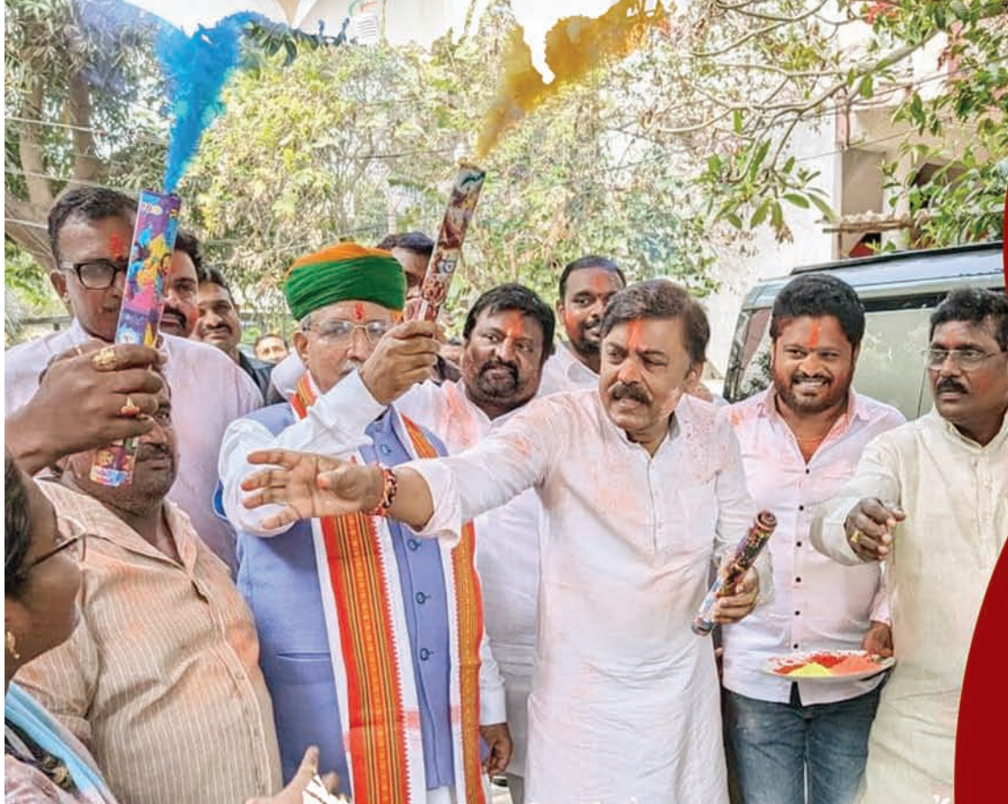
మాజీ ఎంపీ జీవీఎల్ నివాసంలో ..