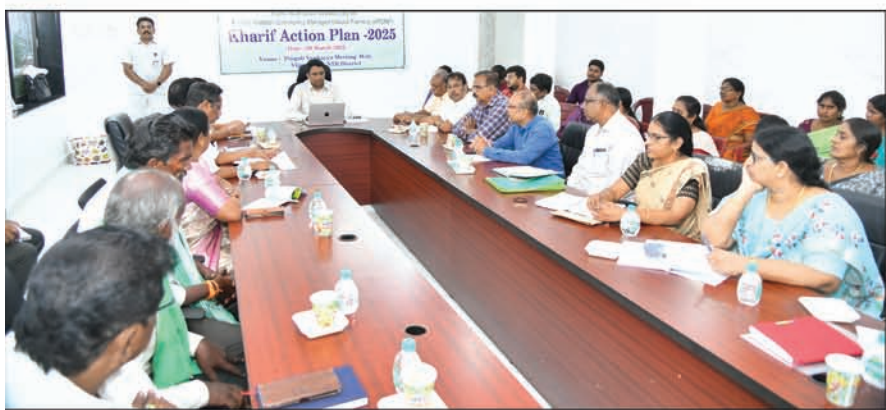
ప్రతి మట్టి రేణువూ.. వర్షపు చినుకూ