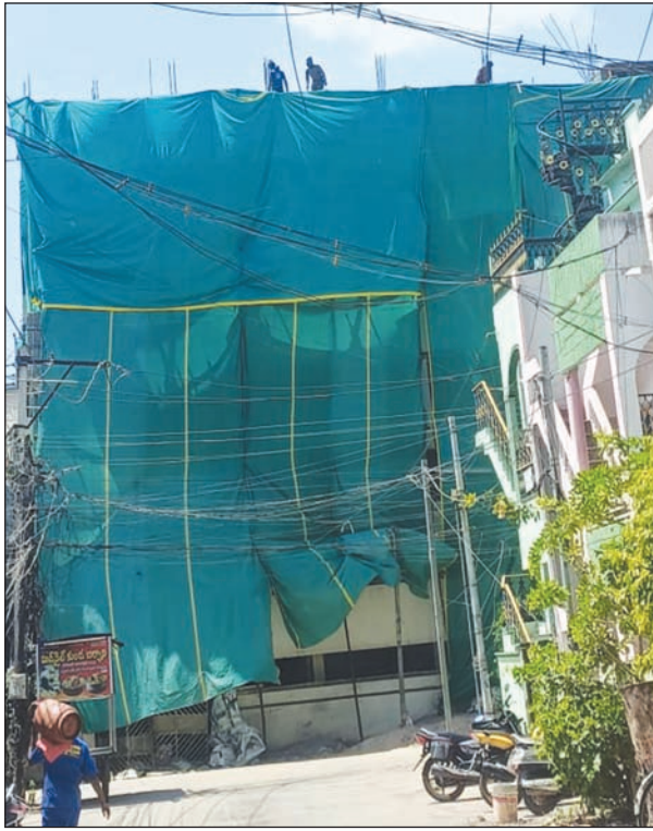
విజయవాడ కార్పొరేషన్, మేజర్ న్యూస్ : దీపం ఉన్నప్పుడే ఇళ్ళు చక్కదిద్దుకోవాలన్న సామెతను నిజం చేస్తున్నారట టౌన్ ప్లానింగ్ అధికారులు. ఉద్యోగం ఉన్నప్పుడే నాలుగు రాళ్ళు వెనకేసుకోవాలన్న చందంగా అక్రమ నిర్మాణం కనబడిన చోటల్ని టౌన్ ప్లానింగ్ అధికారులే డీల్ మాట్లాడుతుండడం బెజవాడలో ప్రస్తుతం హాట్ టాపిక్ గా మారింది. అయితే తాజాగా సిటీ ప్లానర్ పై అవినీతి

ఆరోపణలు పెద్ద ఎత్తున వినిపిస్తున్నాయి. నాలుగేళ్ళుగా బెజవాడలోనే సిటీ ప్లానర్ గా విధులు నిర్వహిస్తుండడంతో నగరంలో ఎక్కడ అక్రమ నిర్మాణం జరిగినా ముడేపులు చెల్లించాల్సిందేనని కింది స్థాయి టౌన్ ప్లానింగ్ అధికారులకు హుకుం జారీ చేశారనే ఆరోపణలు వినిపిస్తున్నాయి. అయితే తాజాగా సిటీ ప్లానర్ ట్రాన్స్ఫర్ అవుతారనే ప్రచారంతో అవినీతి తారా స్థాయికి చేరినట్లు ప్రచారం జరుగుతుంది. తాజాగా విజయవాడ బందర్ రోడ్డులోని డింపుల్ బార్ రోడ్డులో ఓ లాడ్జి భవనంపై అక్రమం నిర్మాణం జరుగుతుంది. అయితే ఆ అక్రమ నిర్మాణాన్ని ఆపాల్సిన టౌన్ ప్లానింగ్ ఎసిపి స్థాయి అధికారే ఆ బిల్డింగ్ యజమానితో లక్షల్లో డీల్ కుదుర్చుకున్నట్లు సమాచారం. అయితే ఆ డీల్లో సిటీ ప్లానర్ కు భారీగా ముడుపులు అందాయనే అందుకే ఆ భవనంపై ఫిర్యాదులు అందినా పట్టించుకోవడం లేదన్న ఆరోపణలు వినిపిస్తున్నాయి. అయితే సదరు సిటీ ప్లానర్ వైసీపీ హయాంలో రావడంతో ప్రస్తుతం విజయవాడ నగర పాలక సంస్థలో వైసీపీ కార్పొరేటర్ల బలం ఎక్కువగా ఉండడంతో సదరు సిటీ వ్యాపారం మూడు వుప్పులు ఆరు కాయలుగా కొనసాగేతుందని ప్రచారం జరుగుతుంది.