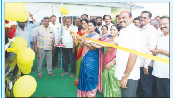
ఎకో బ్లూ యాజమాన్యంకు ఎమ్మెల్యే శుభాకాంక్షలు