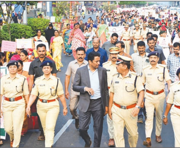
పేదరిక నిర్మూలనలో మహిళల పాత్ర చాలా ముఖ్యం

ఇంటింటా మహిళామణులు పారిశ్రామికవేత్తలుగా ఎదగాలి