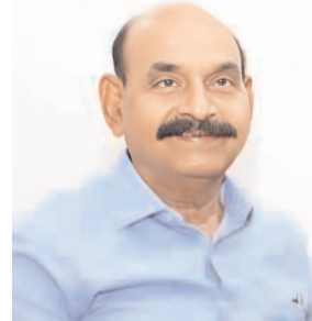
రాష్ట్ర న్యాయశాఖ మంత్రి ఎన్.ఎం.డి. ఫరూక్

నంద్యాల కల్చరల్, మేజర్ న్యూస్ : ఆంధ్రప్రదేశ్ సంవత్సరానికి ఆర్థిక శాఖ మంత్రి పయ్యూపుల కేకవ్ ప్రవేశపెట్టిన బడ్జెట్ లో మైనారిటీ సంక్షేమానికి రూ. 5,434 కోట్లు కేటాయించడంపై రాష్ట్ర న్యాయ మైనారిటీ సంక్షేమ శాఖ మంత్రి ఫరూక్ ప్రశంసల జల్లు కురిపించారు. రాష్ట్రంలోని మైనారిటీ సంక్షేమానికి సీఎం నారా చంద్రబాబు నాయుడు సారథ్యంలో కూటమి ప్రభుత్వం కట్టుబడి ఉందన్న విషయాన్ని ఆర్థిక మంత్రి ప్రవేశపెట్టిన బడ్జెట్ లో ప్రాధాన్యత కల్పించడమే ఇందుకు నిదర్శనమని శుక్రవారం అమరావతిలో విడుదల చేసిన ఒక ప్రకటనలో మంత్రి తెలిపారు. గత ప్రభుత్వ హయాంలో ఐదేళ్ళ కాలంలో మైనారిటీలకు అడుగుడుగునా మోసమే ఎదురైందని మైనారిటీ వర్గాలను మళ్ళిపెట్టి అప్పటి ప్రభుత్వం సంక్షేమాన్ని తుంగలో తొక్కిందన్నారు. మైనారిటీ అభివృద్ధికి కూటమి ప్రభుత్వం రూ. 4376కోట్లు కేటాయిస్తూ ప్రస్తుతం బడ్జెట్ లో అదనంగా రూ. 1058కోట్లు కేటాయించడం జరిగిందన్నారు. మైనారిటీలకు ఇచ్చిన హామీలను నెరవేర్చడమే లక్ష్యంగా కూటమి ప్రభుత్వం ముందుకు సాగుతుందన్నారు. మైనారిటీల లబ్ధి పొందేందుకు వీలుగా సబ్సిడీ రూ. 2512కోట్లు కేటాయించడం జరిగిందన్నారు. గతంలో టీడీపీ ప్రభుత్వ హయాంలో మైనారిటీ సంక్షేమానికి ఎన్నో సంక్షేమ పథకాలను అమలు చేసినప్పటికీ వైసీపీ ప్రభుత్వం మైనారిటీ సంక్షేమ పథకాలను నిలిపివేసిందన్నారు. ఈ పథకాలను తిరిగి పునరుద్ధరణ చేసిందన్నారు. బడ్జెట్ లో నిధుల కేటాయింపు చేయడంపై మైనారిటీ వర్గాల ప్రజలు సంతోషాన్ని వ్యక్తం చేస్తున్నారు.