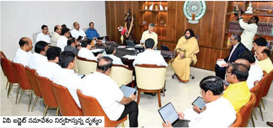
ఏపీ బడ్జెట్ సమావేశం నిర్వహిస్తున్న దృశ్యం

మి పక్షాలు హర్షం ప్రకటించగా విపక్షాలు మాత్రం అసంతృప్తి విమర్శలు గుప్పించాయి. ఈ బడ్జెట్ వికసిత భారత్ లో స్వర్ణాంధ్రను భాగస్వామ్యం చేసేలా బడ్జెట్ ఉందని అన్ని రంగాలకు ప్రాధాన్యత కల్పించారని కూటమి పార్టీలు మోదం తెలుపగా, రాష్ట్ర బడ్జెట్లో కేవలం అంకెలు మాత్రమే కనబడుతున్నాయని ఎన్నికల హామీల అమలుపై ఎక్కడ సుప్రత లేదని ప్రజలను మిగతా 2లో