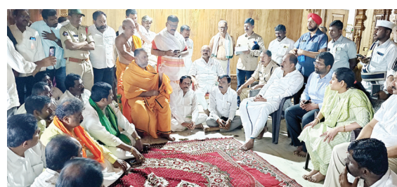
పీఠాధిపతితో చర్చిస్తున్న టీడీపీ నాయకులు