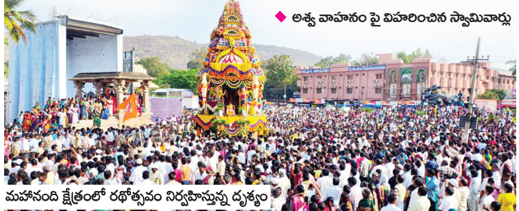
మహానంది క్షేత్రంలో రథోత్సవం నిర్వహిస్తున్న దృశ్యం

మహానంది, మేజర్ న్యూస్ : మహానంది పుణ్యక్షేత్రంలో శ్రీ గంగా కామేశ్వరి సమేత మహానందిశ్వర స్వామి రథోత్సవం అశేష భక్త జన సందోహం ఓంకార నామస్మరణల మధ్య అత్యంత వైభవంగా సాగింది. మహా శివరాత్రి పర్వదినాన్ని పురస్కరించుకొని శుక్రవారం సాయంకాలం నిర్వహించిన రథోత్సవానికి భక్తులకు వేలాదిగా తరలి వచ్చారు. మిగతా 6లో