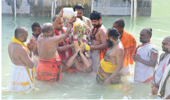
పుష్పలిణిలో చందీశ్వర స్వామికి త్రిశూల స్నానం

శ్రీశైలం, మేజర్ న్యూస్: మహా శివరాత్రి పర్వ దినాన్ని పురస్కరించుకుని నవాహ్నిక దీక్షతో ఈనెల ఈ నెల 19వ తేదిన ప్రారంభించిన శ్రీశైల మల్లన్న బ్రహ్మోత్సవ యాగాలకు శుక్రవారం శాస్త్రోక్తంగా పూర్ణాపాతి నిర్వహించారు. యాగ శాలలో వేదపండితులు ఉత్సవ మిగతా 6లో