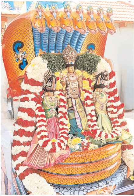
శేష వాహనం పై ఆసీనులైన గోదా రంగనాథ స్వామివారు