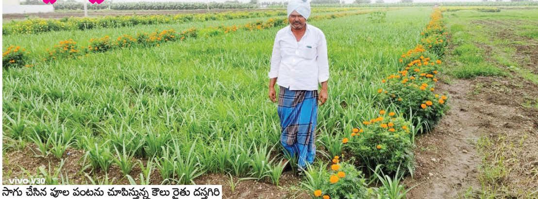
సాగు చేసిన పూల పంటను చూపిస్తున్న కౌలు రైతు దస్తగిరి