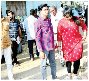
కూతురుకు డైర్యం చెబుతున్న తండ్రి

(మొదటి పేజీ తరువాయి) నగరంలోని 32వ రీజియల్ కేంద్రాల్లో ప్రధానంగా పాఠశాలలోని పలు పరీక్ష సెంటర్ల వద్ద ద్విపక్ష వాహనాలు పార్కింగ్ చేసుకునేందుకు లేకపోవడంతో విద్యార్థుల తల్లిదండ్రులు తీవ్ర ఇబ్బందులు పడ్డారు. పార్కింగ్ ఉన్న స్థలాల్లో కళాశాల యాజమాన్యాలు నిరాకరించడంతో తల్లిదండ్రులు బాహుటంగానే విమర్శలు చేశారు. అధికారులు స్పందించి సమస్యను పరిష్కరించాలని తల్లిదండ్రులకు విజ్ఞప్తి చేశారు.