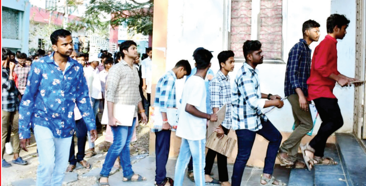
పరీక్షా కేంద్రం వద్ద విద్యార్థులు