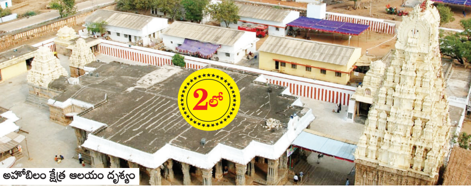
అహోబిలం క్షేత్ర ఆలయం దృశ్యం

నేటి నుంచి ప్రారంభం కానున్న అపహరిల్లం బ్రహ్మోత్సవాలు